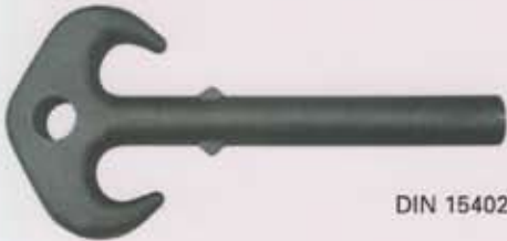
DIN 15402 / B