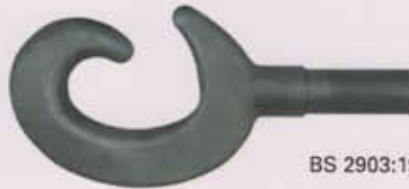
BS 2903:1970 / C